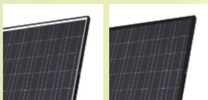
Stražnja folija: bijela / crna.

Proizvedeno i ispitano prema IEC-Normama 61215 i DIN 61730. Certificirano od TÜV-Nord (Br. 4479910387303 - 002). ISO 14001. ISO 9001. OHSAS 18001. Proizvedene s klimatski neutralnim svojstvom.